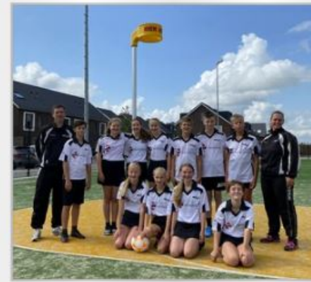
WWSV C1 - 2022