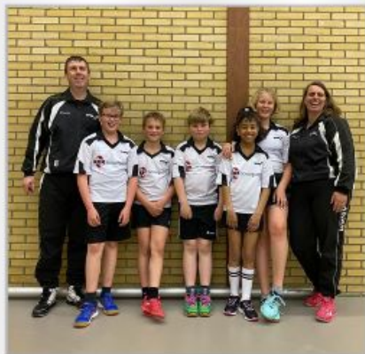
WWSV D1 - 2022