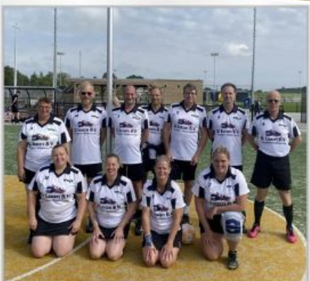
WWSV 2 - 2022