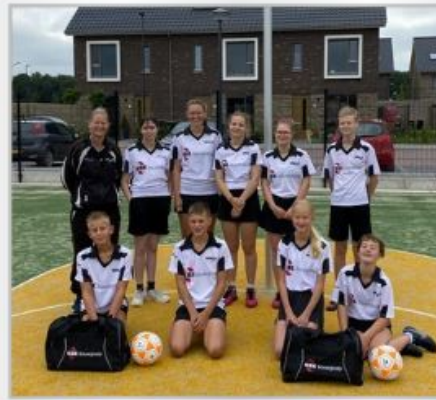
WWSV A1 - 2022