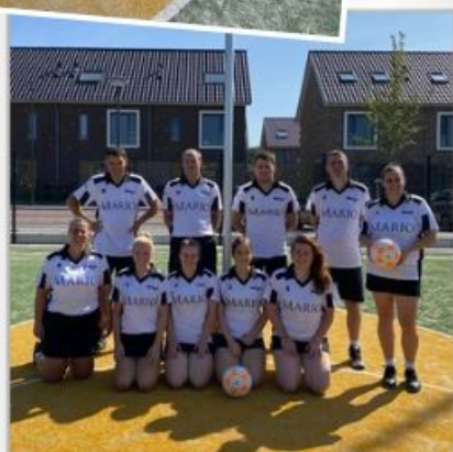
WWSV 1 - 2022